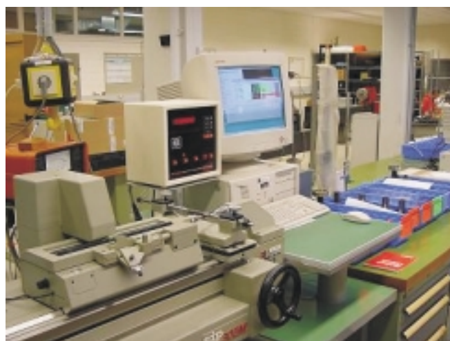
Bild 1. Werkzeug-Messcenter bei MANN+HUMMEL mit EiQMI-Arbeitsplatz

Die Prüfmittelüberwachung nutzt in R/3 das Modul PM (Instandhaltung) in Verbindung mit dem Modul QM. Die Prüfmittel werden als Equipment in R/3 PM geführt. Sie unterliegen einem Wartungsplan, welcher die zeitliche Steuerung der Überprüfung bzw. Kalibrierung übernimmt. Dabei wird bei Fälligkeit einer Kalibrierung mit Hilfe des zugeordneten Equipmentarbeitsplans und der darin hinterlegten Prüfmerkmale im PM ein Auftrag generiert und auf der QM-Seite ein Prüflos erzeugt. Dieses Prüflos wird abgearbeitet und ein Verwendungsentscheid für das entsprechende Prüfmittel getroffen. Für die Abarbeitung der Prüflose wird das Subsystem EiQMI von Dr. Eilebrecht SSE, Leonberg, eingesetzt, um Messwerte zu erfassen und den Verwendungsentscheid zu treffen (Kasten). Mit dem PM-Auftrag können auch die genauen Kosten und Aufwände dem einzelnen Kostenträger oder der jeweiligen Kostenstelle zugeordnet werden. Die Ergebnisse der Prüfungen stehen für eine spätere Auswertung in SAP zur Verfügung.